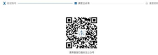
2-7 中国注册会计师协会行业管理信息系统公众号二维码界面

4、个人会员已绑定公众号时会展示验证码接收界面。点击发送验证码可将修改密码验证信息发送到公众号上。个人会员可通过公众号查看验证码，输入验证码后点击【下一步】跳转至新密码设置界面。