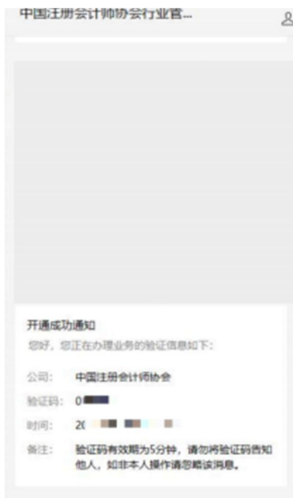
2-2 微信公众号验证码接收界面

2、个人会员在验证码接收界面点击获取验证码，验证码会发送到绑定的“中国注册会计师协会行业管理系统”微信公众号上。填写验证码后点击【下一步】跳转到新密码设置界面。