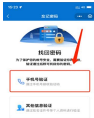
1-5 选择手机号验证界面

1、个人会员在信息验证时会员信息中留有正确手机号，可以通过手机号接收验证码方式找回密码。