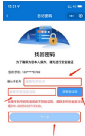
1-6 手机号验证码验证界面

2、填入完整的手机号码，点击获取验证码并输入验证码后点击【下一步】跳转到新密码设置界面。