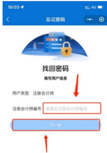
1-4 会员编号填写界面