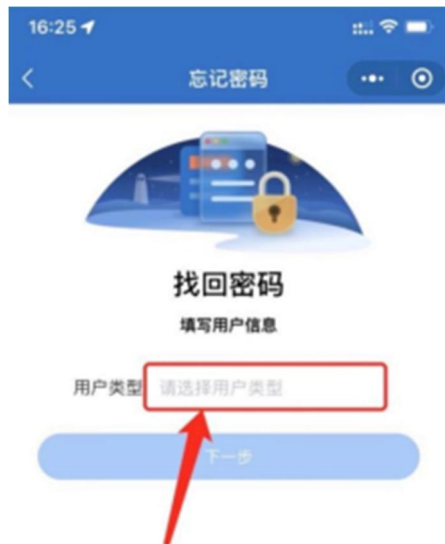
1-3 用户类型选择界面