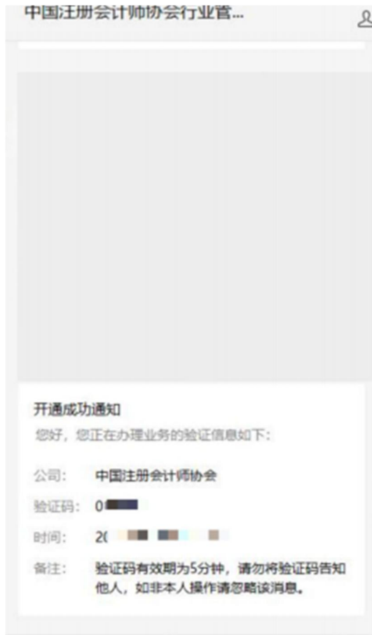
2-8 微信公众号接收验证码界面

4、个人会员已绑定公众号时会展示验证码接收界面。点击发送验证码可将修改密码验证信息发送到公众号上。个人会员可通过公众号查看验证码，输入验证码后点击【下一步】跳转至新密码设置界面。